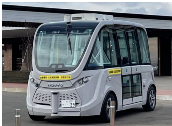
NAVYA社製 自動運転バス ARMA (アルマ) 定員：8名 ※オペレーター除く